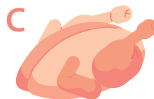
Syrové kuřecí, 100 g