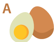
Slepičí vejce, 1 ks, 60g

Přiřadte počet jednotlivých makroživin a množství kilokalorií, které se nachází v následujících potravinách (převzato s www.kaloricketabulky.cz ):