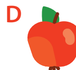
Jablko, 1 ks 150g